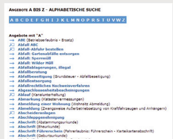
Live-Ansicht über die Dienstleistungen